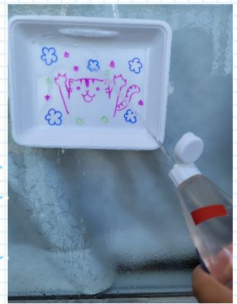
的はトレイに絵を描くだけ！

材料：ペットボトルやケチャップ容器 油性ペン、耐水シールやビニールテ ープ、プラスチックトレイなど