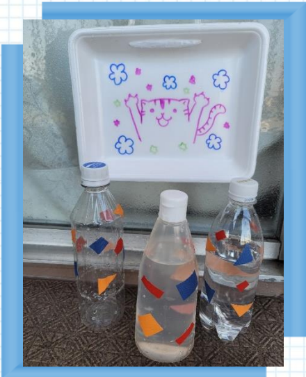
ケチャップ容器は柔らかくて水遊びにおすすめ！